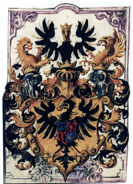
Abb. 1. Wappen der Fürsten und Prinzen Radziwiłł

1547 wurden beide Radziwiłłs von Kaiser Karl v. (1500–1588) in den Reichsfürstenstand erhoben. 9