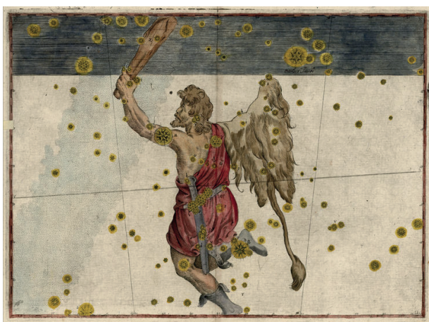
Abb. 5. Orion aus Bayers Uranometria