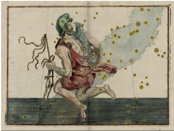
Abb. 3. Auriga aus Bayers Uranometria